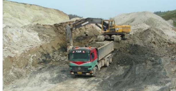
Moler graves eller skrubes sammen og køres til fabrikken

Første gang beskrevet fra 1761 som et muligt poleringsmiddel og siden i 1811 nævnt i et værk om landskabet på Mors. Navnet Moler kan dog ikke kobles direkte til Mors, det hænger nok nærmere sammen med den hvide farve. Moleret blev ikke nævnte meget fordi det meste var skjult. Der var ingen grave og kun svag kystnedslidning indtil 1825, hvor en kraftig stormflod landtangen ved Agger. Disse drastiske hændelser startede den moderne kystnedslidning i Limfjorden og førte med tiden til at et særegent jordlag op med talrige mørke bånd dukkede frem af skrænterne. I 1883 opdagede to belgiske geologer for første gang, at de mørke striber i moleret var vulkansk aske og ikke stenkul, som mange eller fejlagtig havde troet indtil da, hvorfor man i 1809 – 1813 gravede en minegang i Stolleklint – kaldet svenskehulen. Man fremstiller i dag på fabrikken Skamol de isolerende mursten, det er primært til jern og aluminium industrien. På fabrikken Damolin fremstilles kattegrusen og fodertilskud. Der indvindes cirka 130.000 tons der giver virksomhederne en omsætning på over ½ milliard om året.