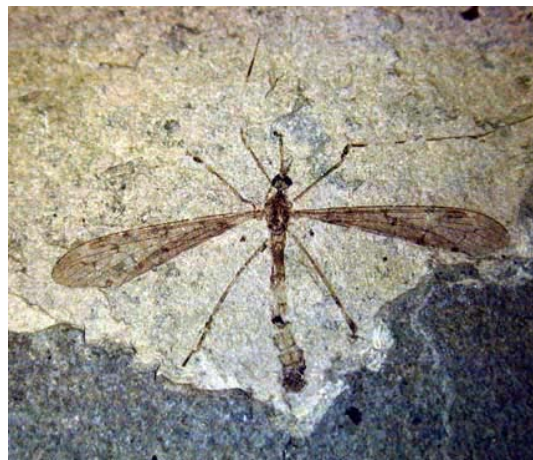
Stankelben i cementsten

dag, tørt subtropisk klima. Insekterne i molerets cementsten er særdeles interessante, fordi de ofte er meget velbevarede med fine detaljer, f.eks. kan man ofte se øjne, hår og farvemønstre bevaret.