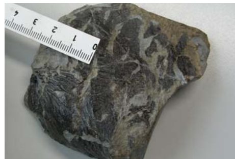
Fossil hud fra læderskildpadde