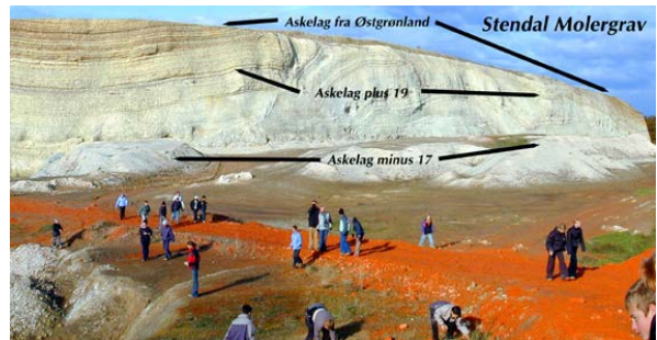
Molergrav med askelag

fra vulkanerne ved Grønland og Færøerne ned til Danmark. Nogle af de øverste askelag svare til top lavaen på basalt vulkan massivet Færøerne. I moleret danner askelagenes karakteristiske bånd en art stregkode. Det er denne geologer bruger til at forstå forekomster og hvordan laget vender, samt er blevet vredet.