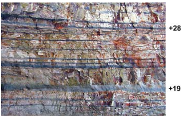
Eksempel på askelag og deres numre

Vulkansk aske stammer fra åbningen af noget af Nordatlanten - faktisk er det Grønlandshavets fødselsattest. Der findes ca. 200 lag af vulkansk aske i Fur Formationen og de ses som mørke (grå til sorte) bånd i moleret. Af de cirka 200 askelag 179 fået numre (-39 til +140). Askelagene varierer i tykkelse fra få mm til 20 cm og farven varierer fra næsten hvid over grå til sort, som er den mest almindelige farve. Specielt askelag minus17 og plus19 har tiltrukket sig stor opmærksomhed, idet man har dateret askelag: minus 17 til at være 55,12 +/- 0,05 millioner år gammelt og plus19 til 54,52 +/- 0,12 millioner år gammelt. En så præcis geologisk alder er ret usædvanlig, hvorfor askelaget nu betragtes som et godt holde punkt for geologisk samstilling i Nordeuropa.