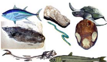
Fossiler vist sammen med eksempler på nutidens slægtsninge

Moleret blev dannet for mellem 55,7 og 54 millioner år siden som havaflejringer af kiselalger, ler og vulkansk aske og det indeholder i dag en rig og velbevaret fossilfauna der indeholder havfisk og krybdyr, samt fugle, insekter, og planter fra landene omkring havet.